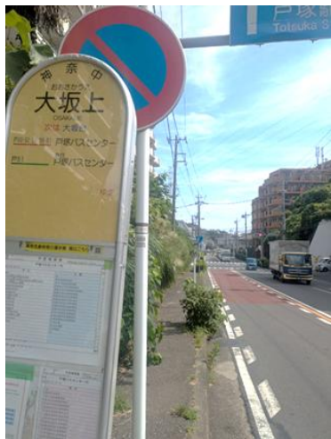
対策前の状況（昨年9月）

2025年9月9日、戸塚駅 行きのバス利用者から、「大坂 上のバス停付近の歩道が雑草 で半分以上おおわれており、通 行の妨げになっています。高 齢者も困っています。除草など 対応をお願いします」との要望 を受けました。