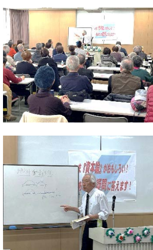
(写真) いま「資本論」が面白い勉強会の様子＝昨年11月23日、男女共同参画センター横浜フオーラム