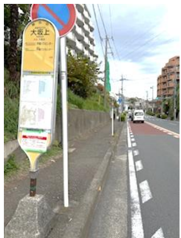
対策後の状況（昨年11月）

役所、土木事務所、警察署に、 雑草の除去を要望する申し入 れを行いました。 その後11月中旬に、相談者 から「申し入れの後、雑草が無 くなり綺麗になり、助かりまし た」という感謝の声が事務所に 寄せられました。