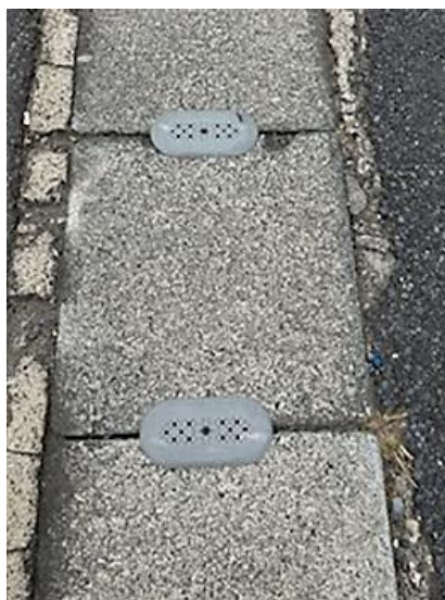
修復後 (撮影) 2月19日