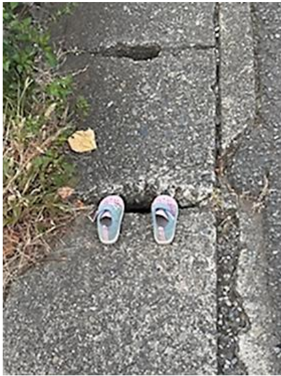
修復前 (撮影) 昨年9月17日