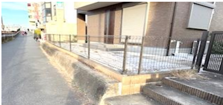
(除草後の状況 撮影 2024年12月30日)