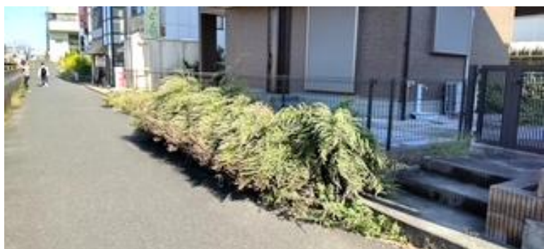
(除草前の状況 撮影 2024年11月4日)