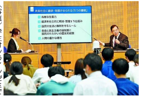
(写真) 学生オンラインゼミで質問にこたえる志位和夫議長 4月27日、党本部

日本民主青年同盟(民青)は4月27日、日本共産党の志位和夫議長を講師に、学生オンラインゼミ第3弾「『人間の自由』と社会主義・共産主義―『資本論』を導きに」を開催しました。