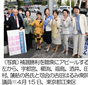
(写真) 補選勝利を聴衆にアピールする左から、宇都宮、榑淵、福島、酒井、田村、蓮舫の各氏と司会の吉田はるみ衆院議員=4月15日、東京都江東区

◆「ほっとスペースとも」無料法律相談◆ 6月19日(水) 18:30~ 事前予約制 協力横浜みなみ法律事務所 ◆なんでも相談◆ 「ほっとスペースとも」で常時受付けています。お気軽にご相談ください。