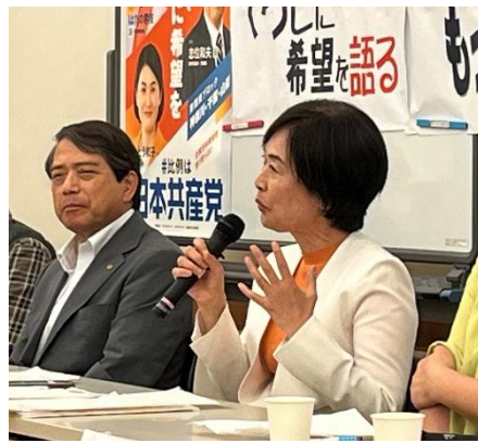
質問に答える、はたの君枝前衆議院議員