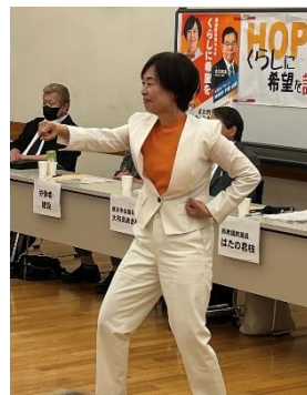
空手演武を披露する、はたの君枝前衆議院議員