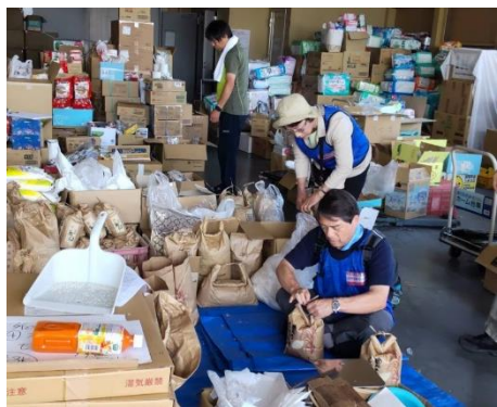
能登半島地震現地支援